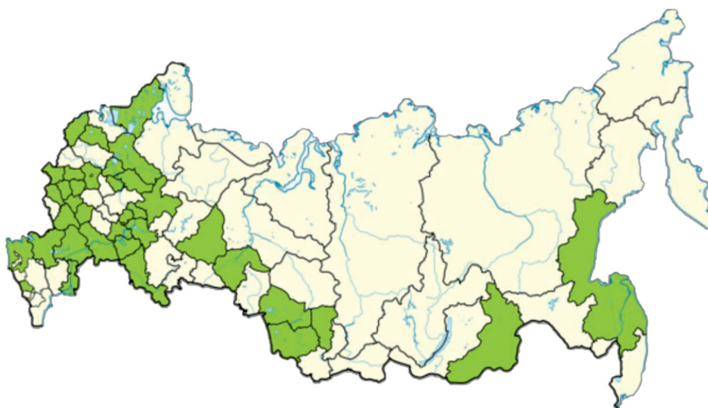
Рис. 3. Территориальное распределение респондентов